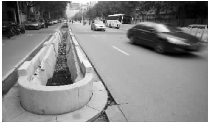
花坛占了半股车道

记者将市民意见转达给了南京市环境综合整治指挥部,负责人表示,目前因为道路施工尚未完成,部分路段还放置着施工围挡,因此造成了暂时的拥堵。围挡全部撤出后,交通状况自然会好转。届时,将会请交管部门重新划线,仍然保持双向四车道,只不过每股车道的宽度略比以前窄一些。“快车道原来每股都很宽,以后哪怕重新划线,每股的宽度还是能符合交通安全标准的。”负责人称,道路出新的规划方案早已经和交通部门沟通过,肯定是符合标准的,不会减少车道,也不会影响通行能力。