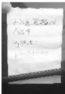
肇事司机留的纸条