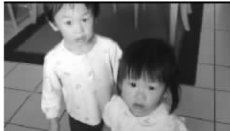
小哥哥声泪俱下劝妹妹向妈妈道歉(视频截图)