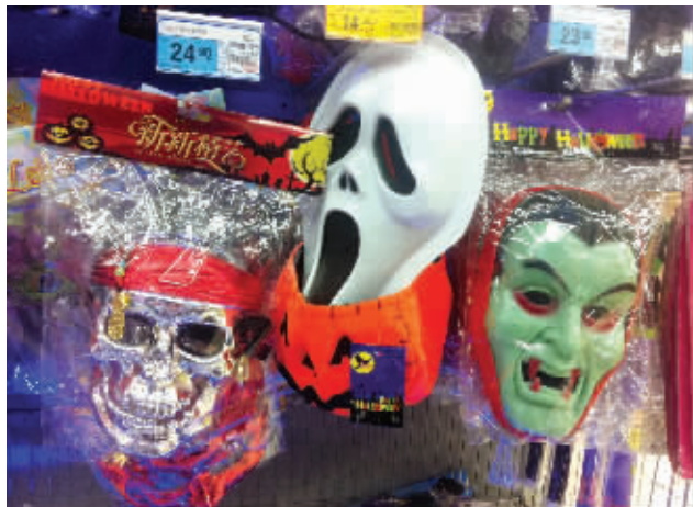
商家售卖的骷髅面具

昨日，记者在多家大型商家都看到了有关万圣节的产品。在无锡万达广场二楼的一家商店里，大幅“步步惊心、闹万圣”的海报挂在店门口。虽说提前有了心理准备，但记者走进店门时还是被吓了一跳：先是一个骷髅头对着记者唱起了歌，随后又有一只张牙舞爪的蜘蛛朝着记者的方向迅速爬来，而蜘蛛旁边的马克杯里还倒挂着一只看上去活生生的老鼠，老鼠的尾巴还在不停地抖动。“别怕，这些都是假的。”见记者露出吃惊的神情，一旁的营业员忙来招呼。这名营业员告诉记者，这些小玩意都是有关万圣节的产品，售价在16元到160元之间不等。“别看这些东西有点小吓人，但销量相当不错。”这名营业员告诉记者，像那个会跳舞的骷髅，他们已经卖得只剩下一个样品。