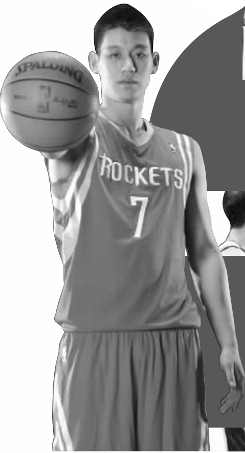
林书豪还能继续疯狂吗?