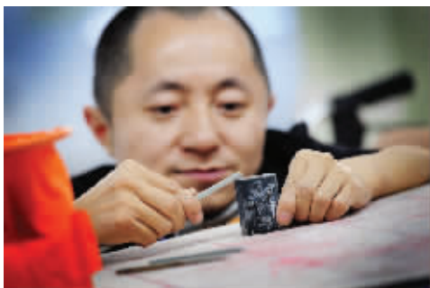
周三中跪在一个软椅上,用手中的一根锉子,打磨着手中的一个“带扣”,带扣是玉石所制,上面的一个“关公”形象已经露出端倪