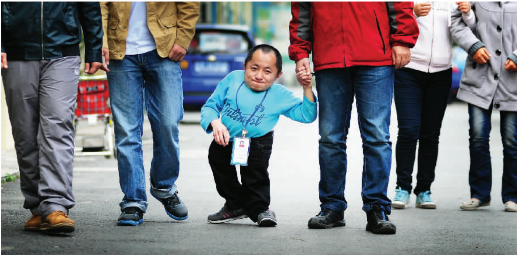
课间,周三中会和同学们一起到教室外走一走,呼吸下新鲜空气

笑一声,也可能断掉一根肋骨 医生曾预言,他活不过40岁 炒股赚过50万,又迷上了玉雕