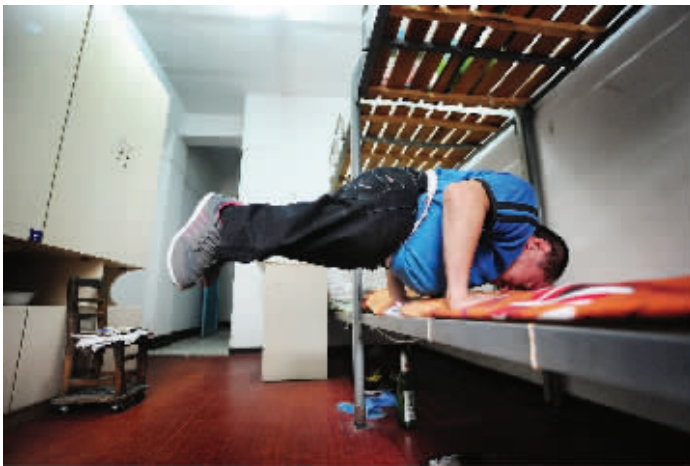
以前动不动就骨折的他,经过精心的调养和不懈的锻炼,现在都能摆出这种“高难度”的动作