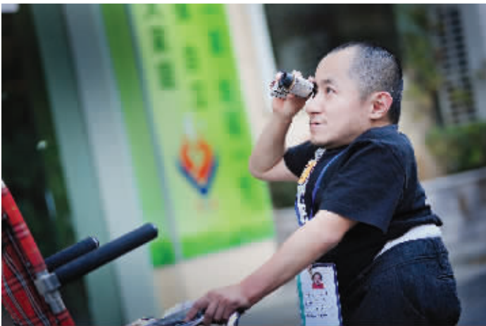
由于个子矮,一些墙上的海报、通知之类的文字,他都要通过望远镜才能阅读