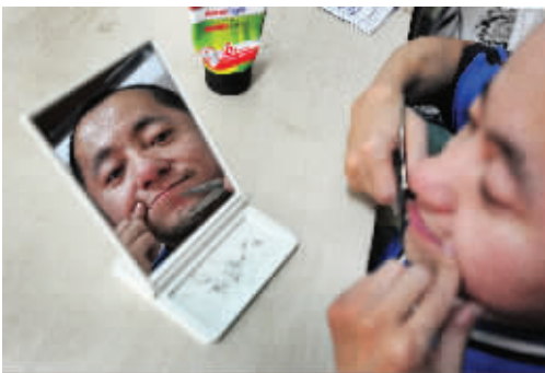
周三中照着镜子,修剪胡子。他觉得,残疾人也要保持好形象