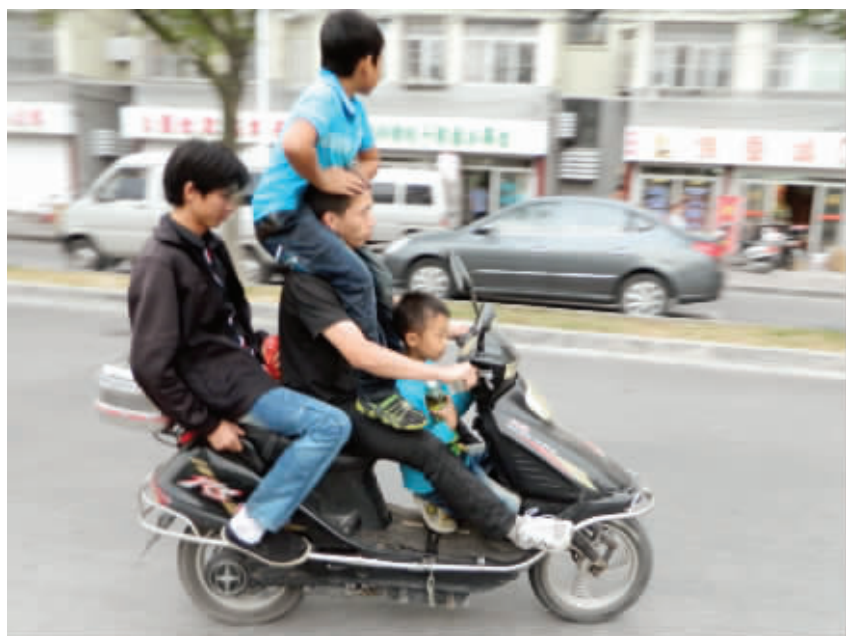
一辆电瓶车上坐四个人,一个孩子坐在驾驶员的头上“拉风”,着实让人惊出一身冷汗。这哪是拉风啊,这明明是在玩命。10月13日摄 (作者汤卫洪获30元话费)