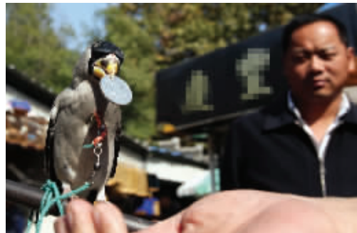
瞧瞧这家伙,看到主人手中的硬币,立刻伸头去“拿”。你是要去买虫子吃啊?反复几次,这个“小财迷”终于得手了。10月19日摄于淮清桥附近 (作者辛先生获30元话费)