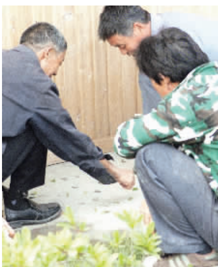
几颗石子,几片树叶,小时候玩的五马棋就是这么简单,老哥俩也重温一下童年旧事吧!10月20日摄于莫愁湖 (作者余耀书获30元话费)