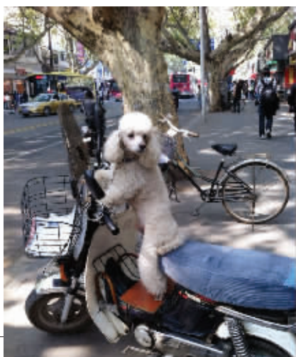
瞧这家伙,人模狗样的,还想学骑电动车呢。10月20日摄于三山街