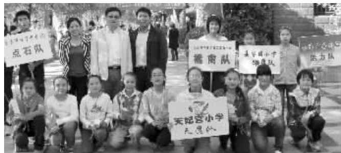
参加无线电测向竞赛的师生合影