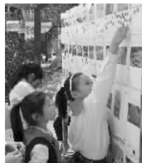
学生将贴纸贴在喜欢的作品上

学生根据活动主题,利用课后时间,走进生活,拍下自然界的微笑。他们的作品包括水、空气、山脉、河流、植物、动物等,有龇牙大笑的小猪、有美味可口的石榴、有突兀峥嵘的石林……各班共推荐了83幅作品,10月15日,集体晨会时间,学校号召全校同学做小小评委,每人有5票,投给自己欣赏的作品;方式是将作为“选票”的梅花贴纸贴在喜欢的作品上。10月18日,学校根据摄影作品的特点以及同学们的选票,最终评出最幽默奖、最囧表情奖、最创意奖、最幸运奖及最