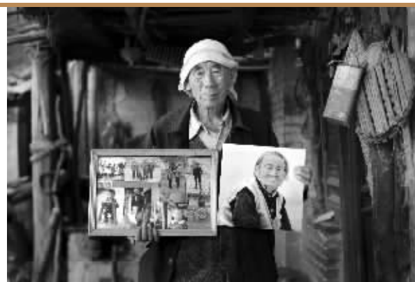
记者连续三年前往陕北李家山拍摄留守老人李爷爷和李奶奶,可是第三年来时奶奶已经走了。爷爷说,奶奶走时的遗愿就是希望能拍一张全家福