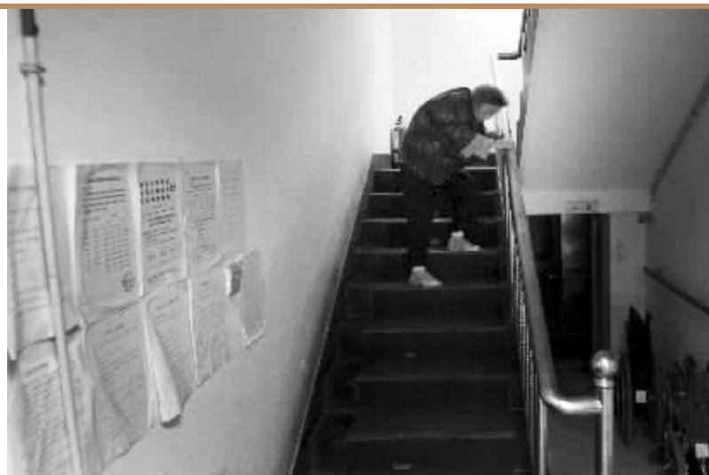
年龄大了,腿脚不利索了。走楼梯成了他们出行最大的困难