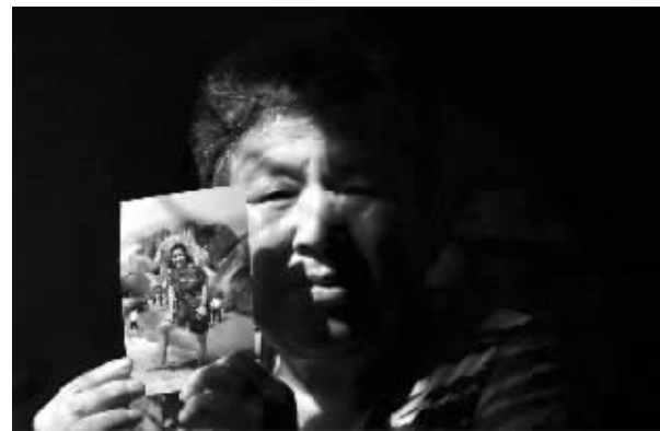
杨奶奶是一位失独母亲,孩子走了,她觉得天都黑了,在中国老百姓活的就是孩子,孩子就是命,没有了孩子就失去了一切