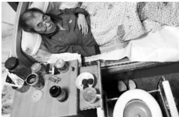
对于长期卧床的老人来说,为了少麻烦别人,他把生活用品都放在伸手可及的地方