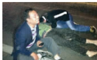
老王瘫坐地上嚎陶大哭,旁边的儿子哭叫“妈妈”,场景令人痛心