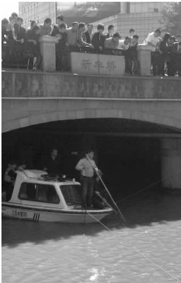
警方在男子跳桥的附近水面打捞

据警方事后调查,该男子姓张,1992年出生,是河南人,在山东某技校上学。女朋友在常州一家企业上班。小张于事发前一天赶到常州来看望女友,没想到女友提出分手。昨天,小张的女友准备送他离开常州。两人走到火车站对面的新丰桥上时,小陈转头对女友说,“让我再为你做最后一件事情……”话音刚落,便纵身跳下了河。目前,警方正在作进一步调查处理。姚斌