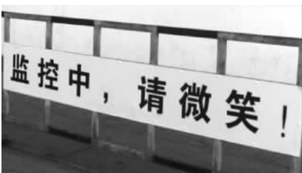
“萌”标语收到意想不到的执法效果