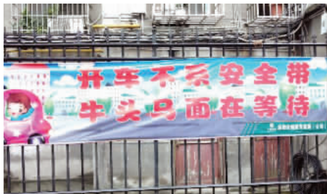
这标语写得太惊悚了吧!