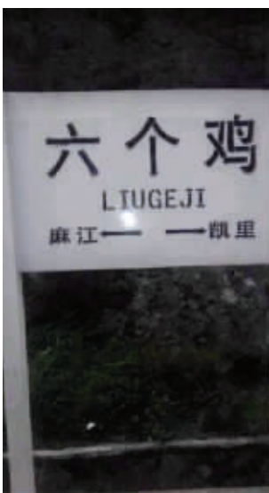
有一个车站,名叫六个鸡