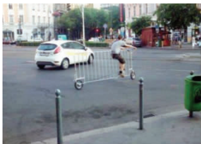
小伙子动手能力很强