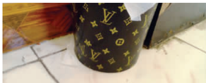
亮瞎了,最奢华的垃圾桶