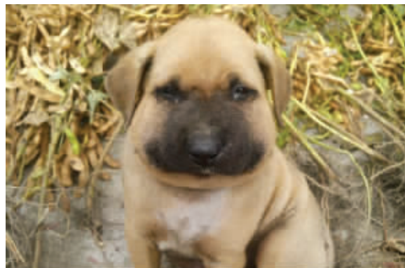
小狗不慎被蛇咬伤