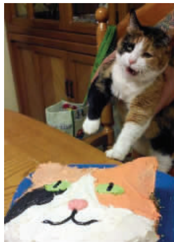
主人,我有这么丑吗?