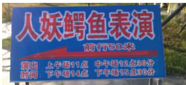
这个招牌起到了吸引人的效果