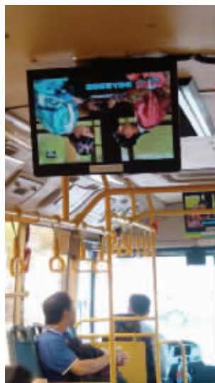
这电视机叫人咋看呢