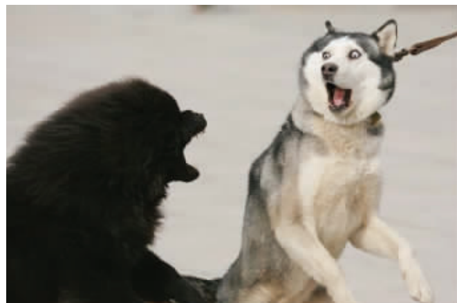
气势上输了,表情却赢了