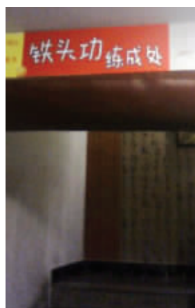
看来练成神功的人不少