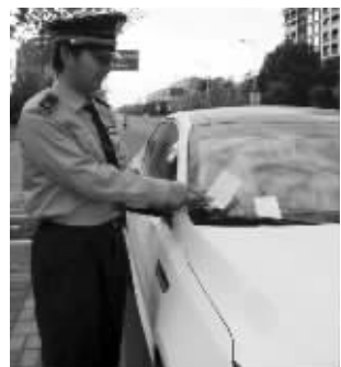
城管工作人员对告知书进行比对

“我车子明明在车位上停得好好的,一会儿的功夫就被贴了单子,真是莫名其妙,城管在搞什么啊。”最近,在张家港市区体育馆附近停车的不少车主,发现明明车是按规定停放,结果却收到城管部门的“罚单”。但是拿起来仔细一看,车主们才发现自己是“冤枉城管了”,原来这些“罚单”只是跟“违停告知书”比较像而已,事实上,它们是张家港一家健身会所的广告宣传单。