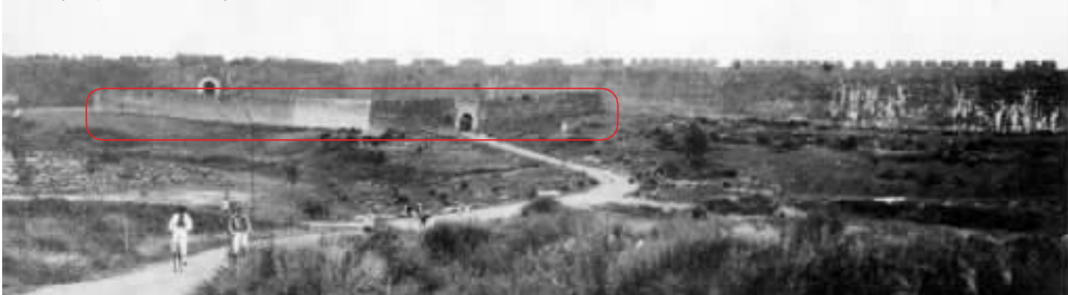
在这张民国初年的照片中,标记的部分为朝阳门外瓮城

不过,朝阳门具体在东安门一线以北多少呢?会是在今天中山门以南吗?记者又查找了明朝都城图、明朝京城山川图、明朝街市桥梁图等图片资料,都显示了朝阳门在东安门、东华门以北,但也并没有具体的标注。并且古人绘图不像今天如此精确,所以地图也无法给我们提供更多的线索。