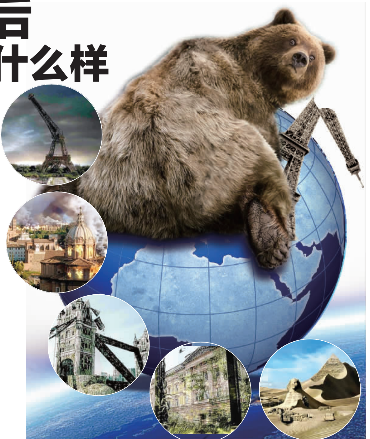
人类消失后,代表现代文明的钢结构建筑坍塌,人类文明终将消失,只留下埃及金字塔,熊成为了世界的主宰