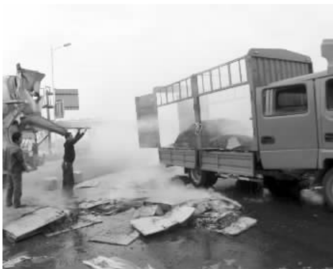
起火现场一片狼藉