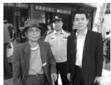
日本老人(左)

昨日上午,随团来无锡旅游的一名92岁的日本老人在游览惠山古镇时不慎和旅行团走失,正当旅行团的工作人员忙碌地找寻他时,正在惠山古镇巡查的公安民警发现了他并把他安全送回了旅行团。当导游看到走失的老人,终于松了一口气。这位92岁高龄的老人也不停地用手势和语言向民警表达自己的感谢。