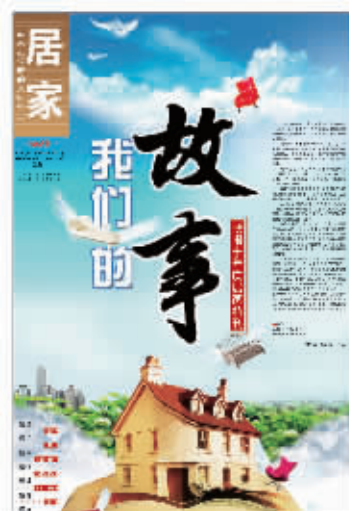
2009年现代快报报庆特刊，《居家》讲述了与行业和广大读者之间的故事