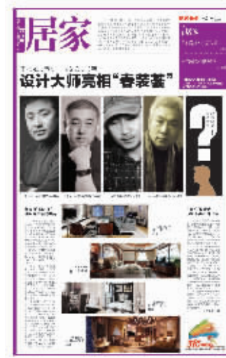
诸多大牌设计师加盟是今年的3·15春装节——现代快报读者家装节的一道靓丽风景