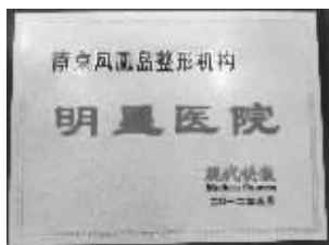
南京凤凰岛整形机构荣获“2012明星医院”

随着整形市场的愈火爆,很多人开始选择眼鼻整形这些“入门级”的手术来改变自己,不仅改动小、改观大,且风险小,收获大。尤其是眼部整形,从双眼皮到祛眼袋,开眼角到祛眼袋等,手术涉及面广、要求高,面对漫天广告里的各种手术方法,应该如何选择?对手术是否了解详细?南京凤凰岛整形机构常年联手现代快报为求美者及时传达讯息,解析手术知识,正值现代快报13周年报庆,南京凤凰岛整形机构推出一系列优惠活动回馈读者。