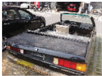
改装的敞篷桑塔纳

快报讯(记者 蒋文龙)近日,苏州有人将一辆破旧的桑塔纳2000型轿车改造成了一辆独座敞篷跑车,有人把这辆“神车”的图片传到网上去,惹得大批网友惊呼:大神级作品!昨天上午,记者来到了位于苏州木渎的这家汽车改装店,看到了那辆“神车”,车顶被完全割去了,前面的挡风玻璃也被切掉了上半部分,车子里面只剩下一个驾驶室的位置。一名工作人员告诉记者,这辆车是他们店里的,是几个工人一起改造的,“没别的目的,就是觉得好玩”。他说这个改造其实很简单,总共的成本还不到2000块钱。该工作人员表示,“就在门前开开玩,不会把它开到路上。”