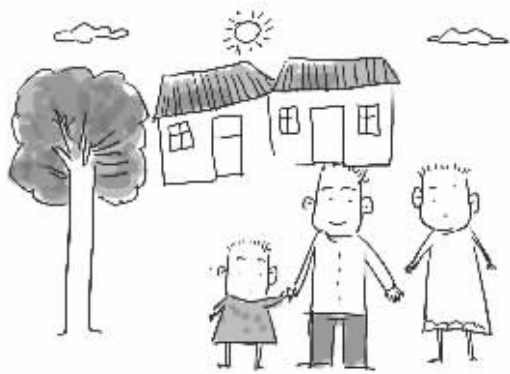
根据娟娟的作品模拟 插画 俞晓翔

昨天是第21个世界精神卫生日,南京脑科医院的精神病患者画展开展,其中有17幅画是儿童作品。脑科医院专家说,其实越小的孩子,涂鸦作品越能反映内心世界,如果家长注意观察,并且掌握一定技巧,就可以读出孩子内心的小秘密。在医学上,医生利用这种方式来观察孩子的病情,而在生活中,实际上可以看出孩子的情绪。 □通讯员 徐晓蓉 现代快报记者 刘峻