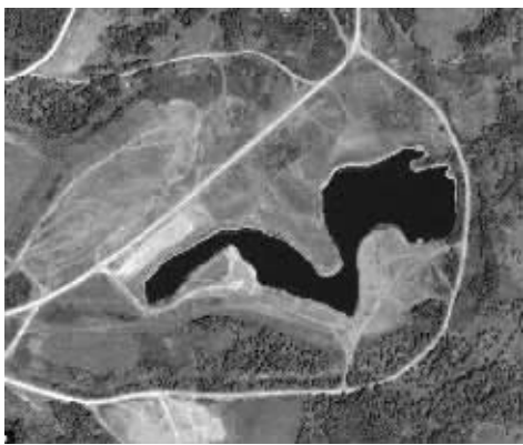
位于俄罗斯西南部车里雅宾斯克州的卡拉恰伊湖