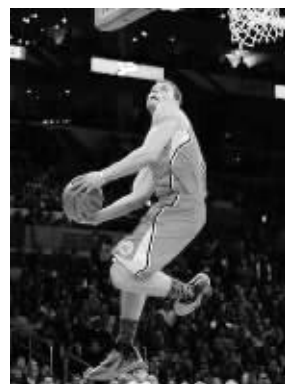
给力芬要在中国上演暴力灌篮

9日下午,快船全队爬了长城,第一次来中国的格里芬对这里的一切感到很新鲜,他被长城的壮丽所折服,而走进设施完善的万事达中心后,他又抑制不住战斗欲,这个充满能量的年轻人已经迫不及待地想比赛快点开始。雷·阿伦的加盟让热火凑齐了“四巨头”,而快船队方面,保罗不能出场,比赛可能演变成格里芬一人对抗热火四巨头,但是格里芬并不畏惧,赛前训练他显得能量无限,