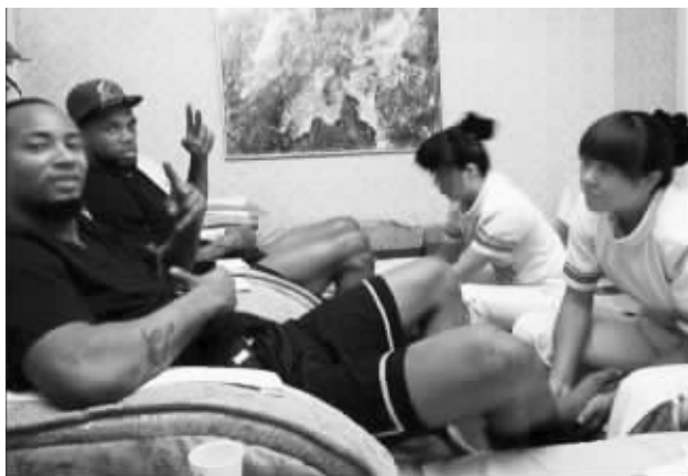
虽然画面里没有詹姆斯,但是这两位球员的确是詹姆斯带去足疗的