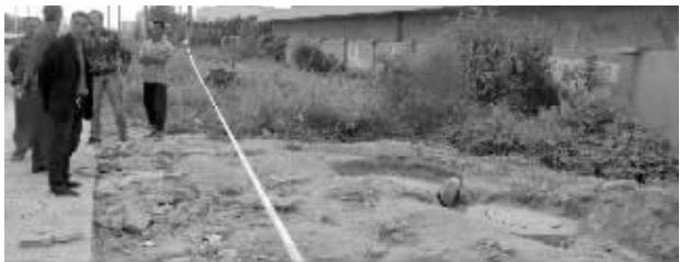
事故现场被拉起了警戒线