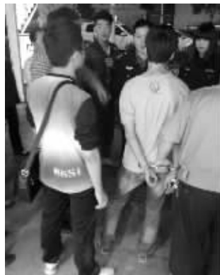
民警将小偷带走

此时,路过此地的宋先生发现这一情况,赶紧上前和石先生站成一排,两人合力先将小偷按在地上,然后掏出了手机报警,由于当时洪武北路和中山路路