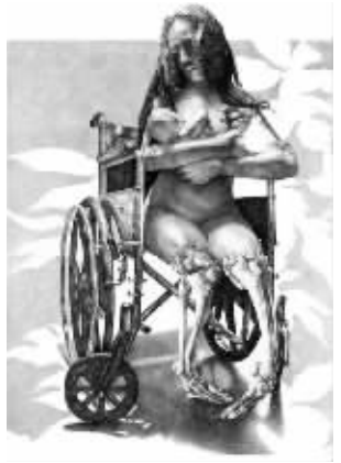
卡斯提格利亚的“血画”作品