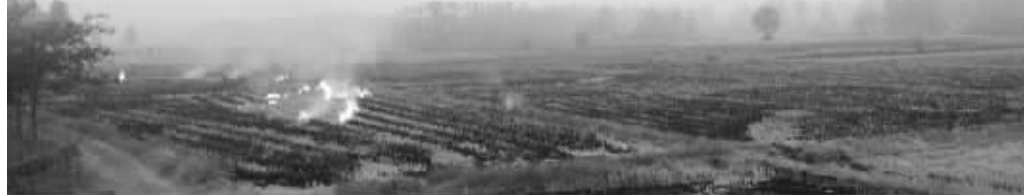
宁连高速沿线,随处可见这样的大面积焚烧秸秆

为了避开假期最后两天的返程高峰,从昨天开始,不少南京市民陆续从旅游度假地返宁。不过在令人愉悦的回家途中,秸秆焚烧所带来的遮天蔽日的浓烟,却彻底破坏了人们轻松的归家心情。而10月5日的监控显示,南京空气污染指数133,为轻微污染。这是否正是秸秆焚烧惹祸?