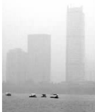
昨天,南京城灰蒙蒙的,能见度很低

今天 多云到晴,东到东北风3-4级,16℃~26℃ 明天 晴到多云,13℃~26℃ 后天 多云,12℃~24℃