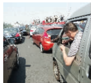
路上拥堵,司机剪起指甲