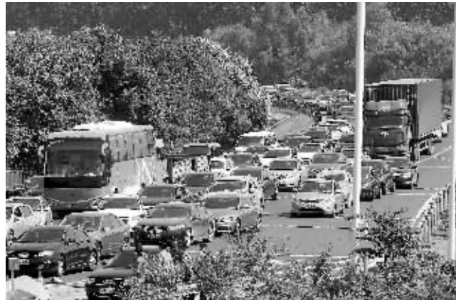
昨天,绕越高速往长江三桥方向严重拥堵

对于此次路面的情况,吉先生再次感慨,“从未见过,可以说路上的车辆是以前节假日的两倍还多。”