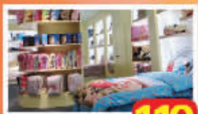
迪士尼儿童床品套件 119元起