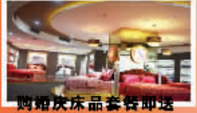
购婚庆床品套餐即送 1000~5000元豪礼