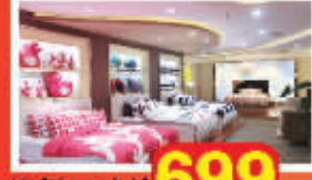
柳桥羽绒被 699元起 (限10套)