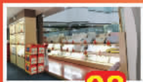
梦百合记忆枕 98元起