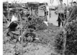
电动车面目全非