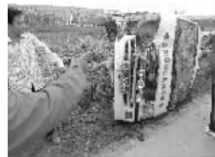
救护车侧翻