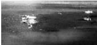
现场血迹和被撞掉的鞋子

断,如果救护车当时逆向行驶,往左打方向时撞了人,由南向北的车道上也应该有印迹,而且刹车印的弧度肯定很大,而不是现场呈现的模样。