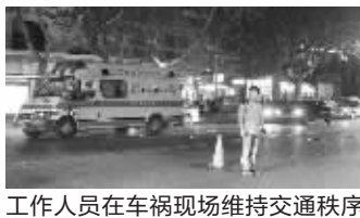
工作人员在车祸现场维持交通秩序

观察现场的刹车印迹,由北向南车道上有一条不足十米的刹车印,这个印迹是一条往右的弧线,弧度并不大。一位围观的司机判