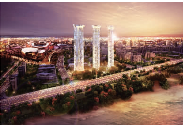
滨江壹号外景效果图

金九银十,苏宁置业“品质阵营”震撼南京城市,四大楼盘将先后入市。在新街口苏宁电器广场顶级酒店式公寓样板公开之后,苏宁置业2012献礼南京的巅峰之作苏宁滨江壹号,终于在昨日(9月26日)揭开神秘面纱,大批业界人士和高端客户争相前往观摩,绝美样板和世界顶级团队打造的实景展示示范区惊艳全场。