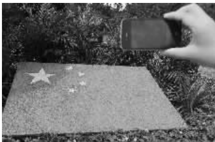
7万多颗红豆黄豆拼成国旗

9月28日~10月30日,古林公园举办第二届秋花秋实展。数月前,公园就专门辟出了一块“开心农场”种瓜种菜种花,眼下已到了收获的季节,让久居城市的人们不出城就能感受到硕果累累的丰收喜悦。