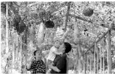
“开心农场”吸引了游客看稀奇