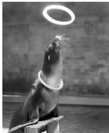
套圈真是小意思

今年7月,可爱的加州海狮Lou从比利时动物园飞到南京,经过一段时间的隔离检验检疫,终于可以公开亮相啦。人家可是海狮大家族里智商最高的。现在,握手、敬礼、翻滚等等动作,它都已经学会了,唱歌更是不在话下。