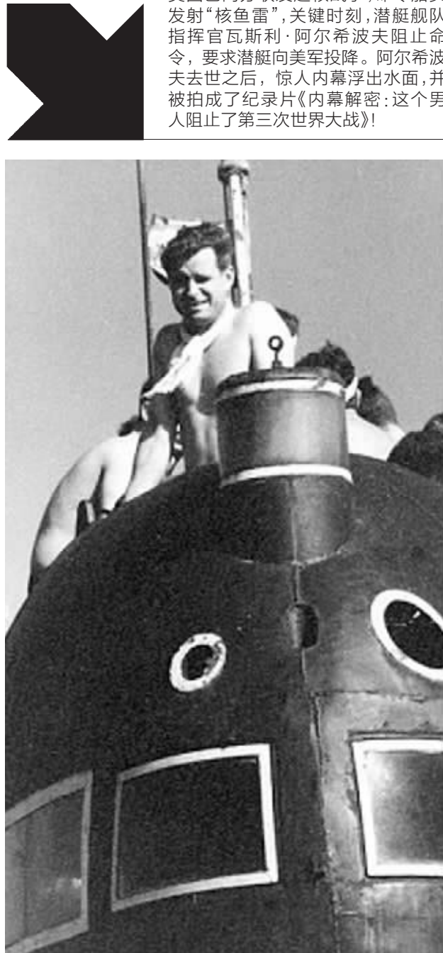
阿尔希波夫在一艘苏联潜艇上