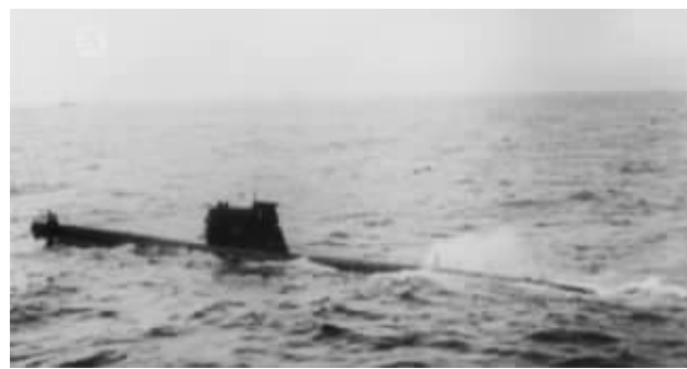
古巴导弹危机期间的一艘苏联潜艇