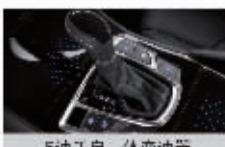
6速手自一体变速箱