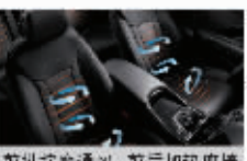
前排按摩通风、前后加热座椅