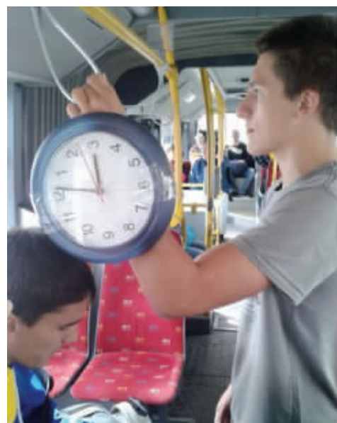
哥们,你的手表霸气了