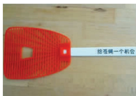
凡事都要给人留条后路