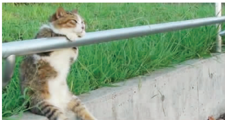
我等的人儿,你肿么还不来