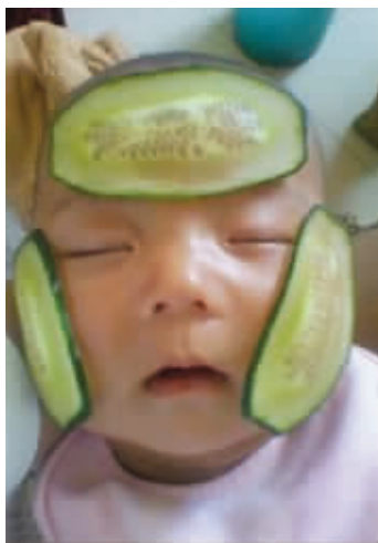
天气干燥,拍个黄瓜