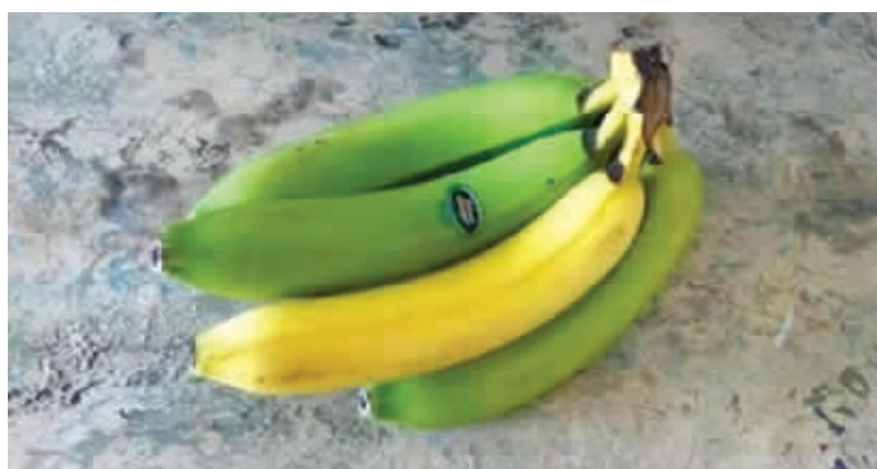
有一个衰老得很快啊