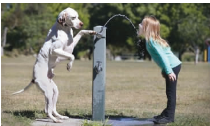
狗狗是人类最好的朋友