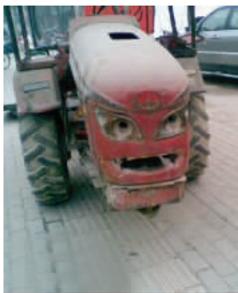
你是潜伏在地球的机器人吗