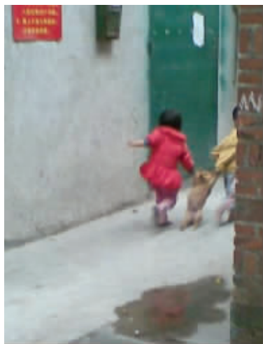
主人,我冤枉啊,主人!