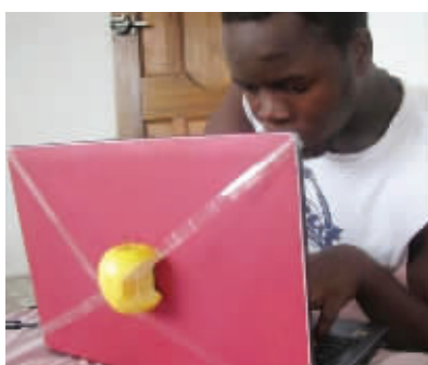
终于拥有了自己的苹果