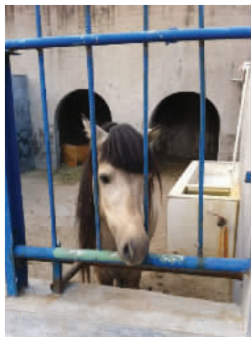
长脸加齐刘海,杯具了吧