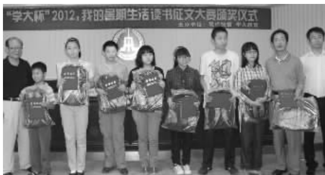
获奖选手合影留念