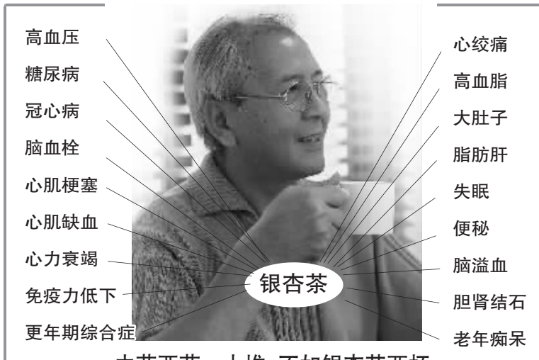
中药西药一大堆 不如银杏茶两杯