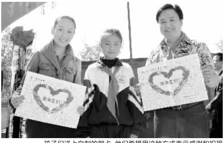
孩子们送上自制的贺卡,他们希望用这种方式表示感谢和祝福