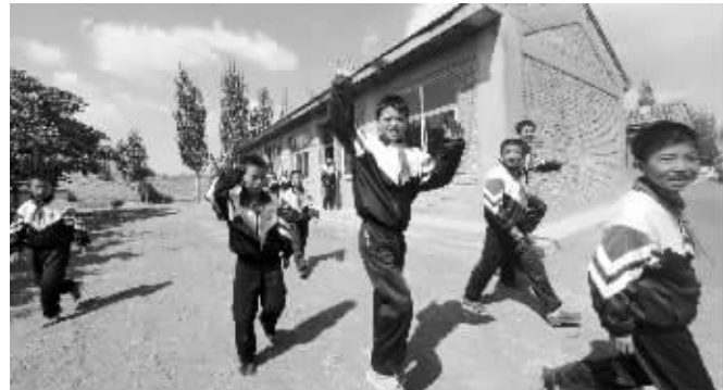
在新教室上课,身着新校服的同学们非常开心