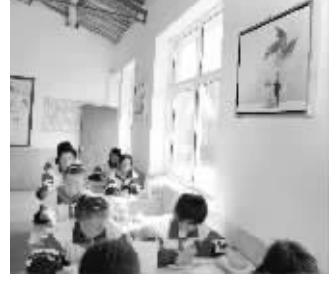
爱心企业捐的油画挂在了新教室

为了利用好新校园里的新设备,老师们也下了不少功夫。很多新排了课表,为孩子们下载了很多电影、名师辅导教程和学习资料,不仅用现代化设备改进课堂教学方式,还极大地丰富了孩子们的课余生活。“真的要谢谢你们,是你们给了孩子最好的学习环境。”在教室后方的墙上,老师们和孩子们还有心后布置出一块展示栏,并将其装饰成了学习交流园地。新学期伊始,孩子们纷纷将自己对新校园的感受和祝福写成卡片,挂在里面。