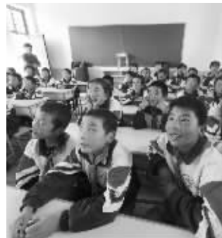
学生们在新建的多媒体教室看电影,非常开心

其中,多媒体教室是最受孩子们欢迎的,大家都喜欢看 ней电影,每天中午多媒体教室都坐得满满的,没有空位,高年级学生主动站在教室后面。对孩子们来说,每一部电影都是新的,都充满了欢笑和知识,这是他们认识世界、了解世界最好的方式。