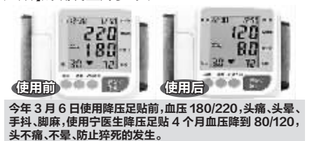
今年3月6日使用降压足贴前,血压180/220,头痛、头晕、手脚、脚麻,使用宁医生降压足贴4个月血压降到80/120,头不痛、不晕、防止猝死的发生。

今年,上海北京等地非常流行一种“踩着膏药降血压”的神奇新疗法,很多老年人对此赞不绝口:“每天吃药一大把,冠心病、头痛、失眠,用了这降压贴,全都有了好转!”“晚上血压高,头昏脑涨、心脏憋闷,觉都睡不好,用了【宁医生降压足贴】的确明显好多了!”