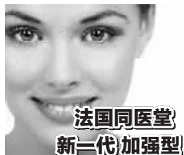
法国同医堂 新一代加强型

同医堂祛眼袋消纹紧致眼部精华液,特有的溶脂活性因子,就像液体手术刀能够对眶周后增生的脂肪进行溶解分化,清除皮下多余的脂肪粒子,排出积存眼液,平复眼袋;同时三维弹力蛋白和胶原蛋白,直接作用于皮肤深层,激发原已干瘪的眼部细胞二次生长发育,从而收紧眼部皮肤,无论是大眼袋、黑眼圈、鱼尾纹、眼皱纹,一抹就没,终身不反弹!