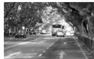
南唐的“新街口”:中华路