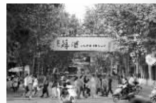
六朝的“新街口”:太平南路