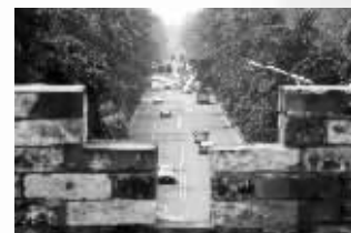
明朝的“新街口”:御道街