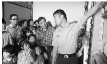
消防队员向参加现代快报“少年实践营”的读者介绍情况

胶靴,然后穿上衣、戴帽子,束腰带和佩戴专业工具,全套穿完,用时竟然不到10秒钟,让孩子和家长情不自禁地鼓起了掌。“太厉害了,简直不可思议。”一名参观的小男孩说。