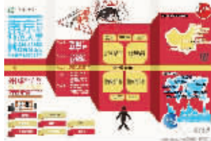
西班牙语版