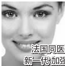
法国同医堂 新一代加强型