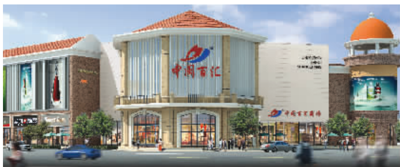
位于雨花台区玉兰路与丁墙路的交会处中闽百汇商场今天盛大开业

随着南京南站的开通,宁南商业再次被炒热。据了解,位于明发商业广场的中闽百汇商场经过一年多的筹备将在今天盛大开业,定位中档综合性百货商场,中闽百汇商场意在为周边消费者提供物美价廉的商品,更以优质的服务给消费者带来愉悦的购物体验。开业前期,中闽百汇商场还将推出一系列优惠促销活动。