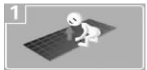
1 隧道每隔80米就有疏散盖板