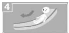
4 沿滑梯下滑到安全疏散廊道

据南京交管局预测,长假期间,南京境内各条高速预计车流量同比上浮近40%。面对如此大的车流,如何开车才能安全呢?现代快报记者采访了南京境内多条高速的负责人,而他们共同的建议就是:上了高速公路之后,要控制好车速,尽量少变道,这样才能确保安全。