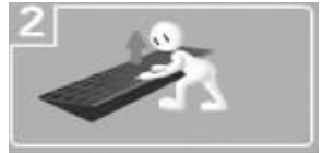
2 双手拉起手柄,脚勿踩盖板