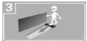
3 向上拉开盖板,可以看到滑道