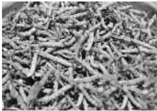
虫草正品

手段也是层出不穷。“最离谱的要数冬虫夏草被插入铁丝、钢丝、铜丝等,再浸泡明矾和苏打水,以达到增加重量的目的。”专家介绍,除了掺杂其他东西增重,冬虫夏草的造假也很严重,主要有以下几种手段。一是移花接木。不法商贩将一些外观像冬虫夏草的昆虫晒干后,头上插入其他干草冒充冬虫夏草。二是虚报产地。有人用产于湖南、广西、江西、安徽等地的亚香棒虫草和新疆虫草冒充西藏的冬虫夏草。三是模型加工。选用面粉、玉米粉、淀粉、石膏等材料,用特制的虫草模具压成模型,然后上色晾干,冒充正品冬虫夏