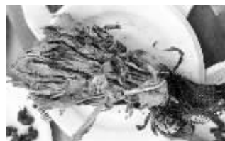
正品雪莲有点像娃娃菜