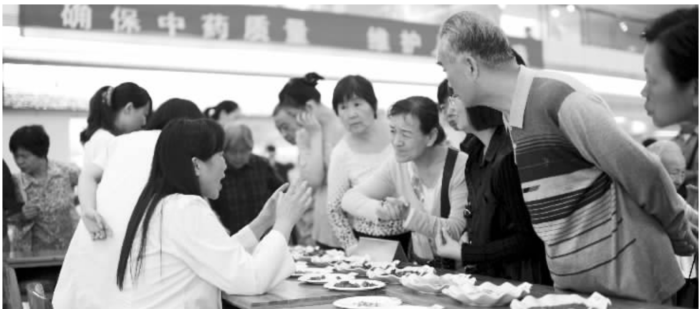
中药真伪鉴别活动吸引了很多市民参与