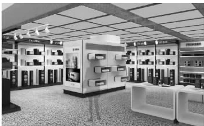
苏宁商茂超级店Music Max家庭影院体验区

通过智能终端即可完成电子化购物、全球高精专新品“零时差”首发、顶级品牌展示区的超前体验……这不是在电影中才能展现的场景,在9月30日开业的苏宁商茂超级店都将变为现实。据了解,苏宁商茂超级店作为苏宁着力打造的高级家电MALL,依托苏宁科技强有力的支持及众多高端品牌的强势入驻,着力让每一位消费者切身感受到未来生活的气息。未来,苏宁商茂超级店将成为南京本土的家电生活设计师,成为新街口另一张高端名片。