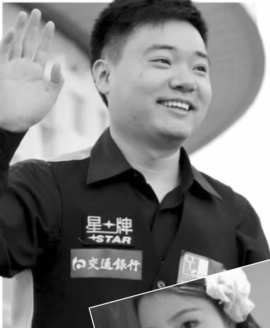
丁俊晖经常在微博上谈到与女友相处的趣事

当然,输掉比赛,并没有影响小晖的心情。昨天,小晖接受了微访谈,他的女友Apple也一直在微博上与小晖有互动,Apple更是微博爆料,“小外甥女不停地喊‘舅舅,舅舅’,某人自作多情地超级开心。”