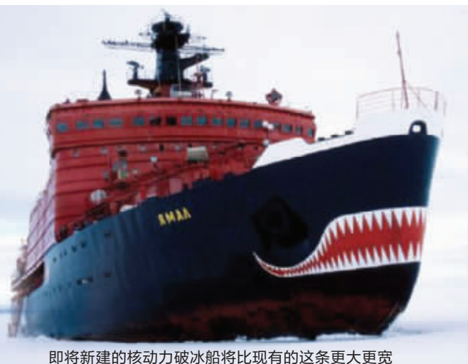
即将新建的核动力破冰船将比现有的这条更大更宽

俄罗斯是全世界唯一有能力建造核动力破冰船的国家, 由于现有核动力破冰船即将退役, 俄罗斯国有原子能公司日前宣布, 将计划建造一艘世界上最大的新型多功能核动力破冰船, 预计该工程耗资11亿美元。