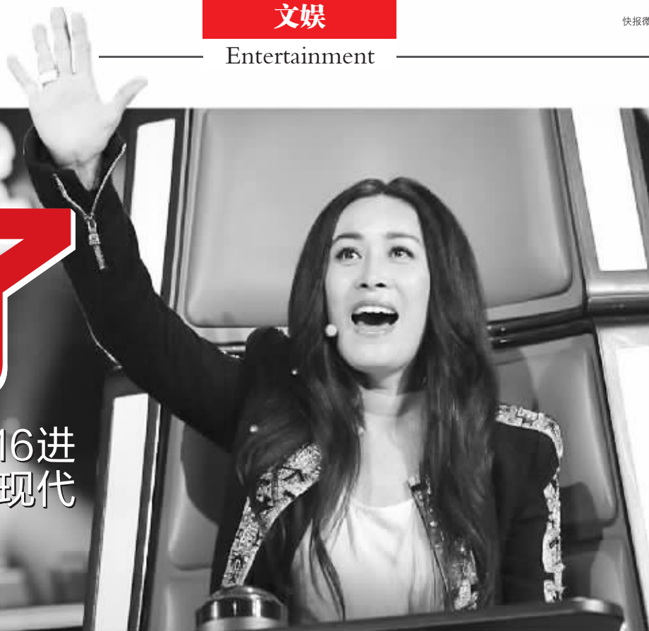
4位爱将只能选一个，那英会不会很纠结？